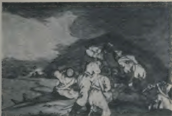
Les Mamelouks violant des femmes espagnoles.